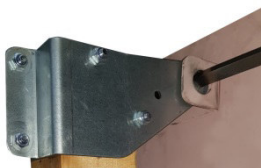
Plate 460/610 120,00 €*